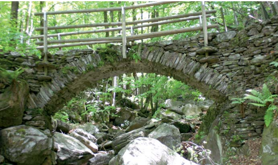
Eine der uralten Steinbrücken im Valle Cannobina.

Weitwanderweg, der in 55 Etappen durch die italienischen Alpen führt. Campello Monti ist Übernachtungsort zwischen Etappe 2 und 3. Wer auf dem gut markierten Weg von Forno nach Campello Monti wandert, wird vieles in Erinnerung behalten. Den tiefblauen Himmel der Südalpen, dicht bewaldete Berghänge, oft noch Schnee tragende Gipfel, alte verlassene Steinhäuser und vor allem den bunten Blumentepich der Wiesen. Zwei Arten fallen besonders auf: die strahlend weißen, trichterförmigen Blüten der Paradieslilien und die vereinzelt vorkommenden Lago Maggiore-Narzissen; ebenfalls weiß, aber mit kranzförmig angeordneten Blütenblättern und gelben bis roten Nebenkronen.